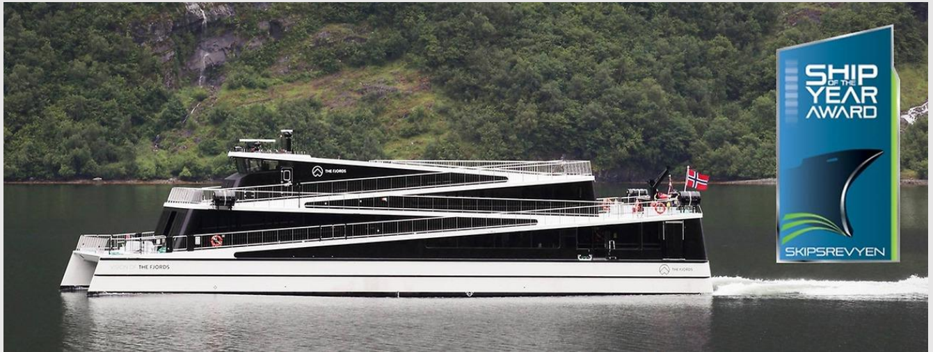
Aussenansicht Vision of the Fjords

Vor allem wegen seines innovativen Antriebsstrangs wird der futuristische Katamaran Vision of the Fjords aus der norwegischen Werft Brødrene Aa AS zum Schiff des Jahres 2016. Der Parallel-Hybrid Antriebsstrang von MANCRAFT AS setzt neben dem MAN-Dieselmotor auch ein Elektroantrieb ein. Das Zu- und Abschalten des Dieselmotors auch unter Last wird durch eine speziell für den Einsatzfall entwickelte Mönninghoff Polreibungskupplung ermöglicht.